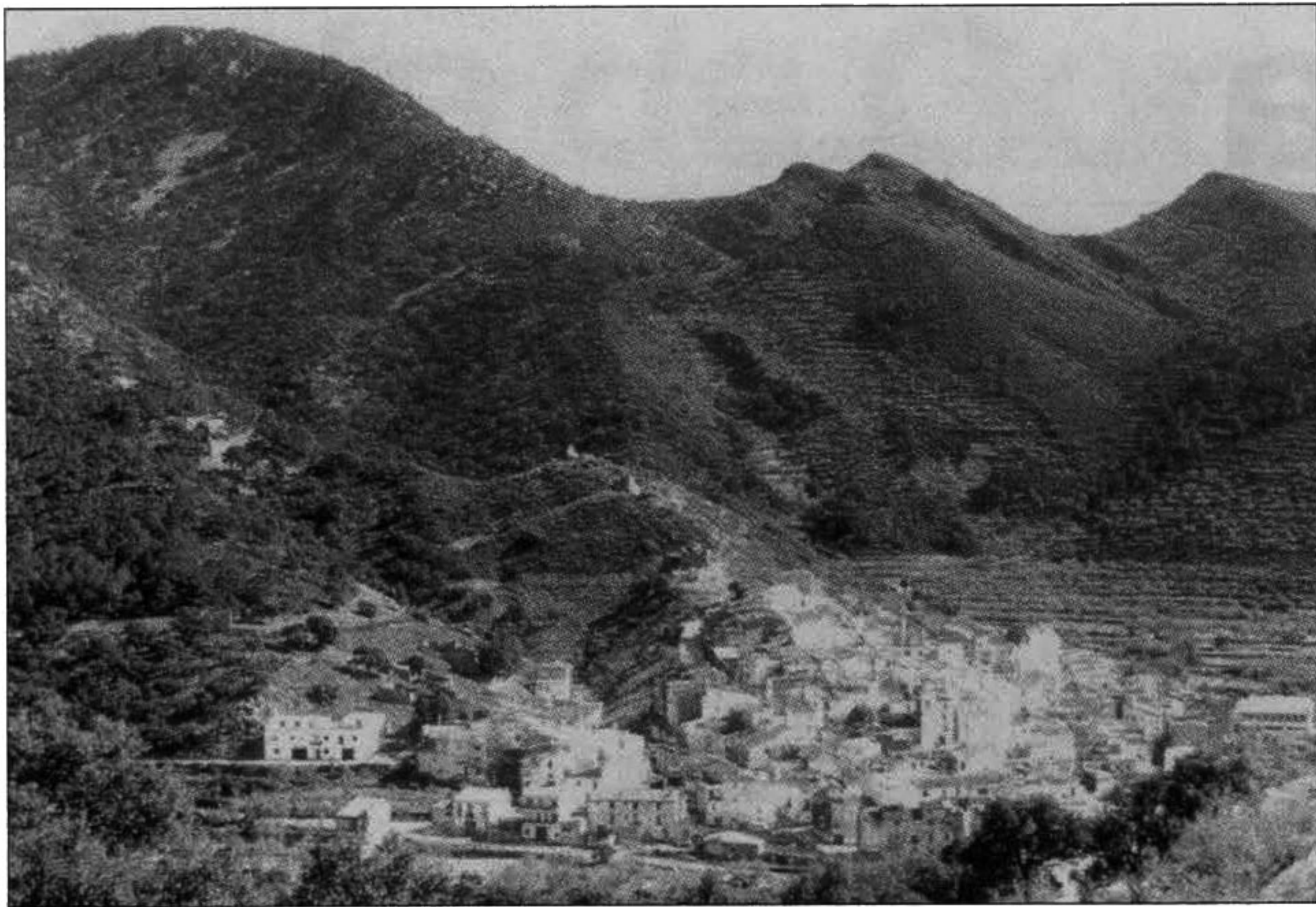
Imagen de Chóvar, un paseo por la sierra de Espadán.