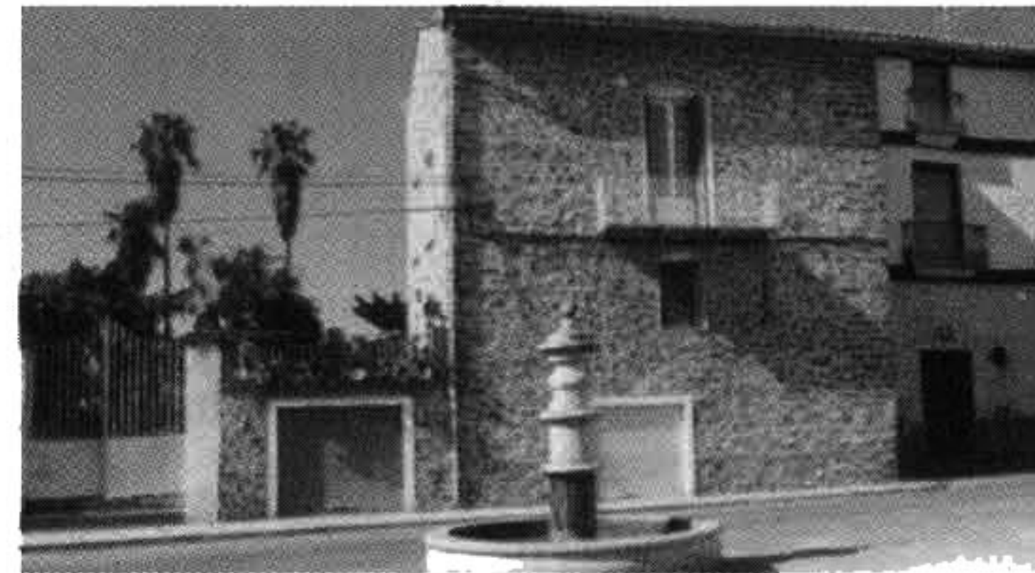
Ermita de San Francisco Javier y plaza de la Mirla.

perfil arquitectónico y una estructura urbana que evoca su antigua habitabilidad árabe. Calles como Trasagrario, Calvario, Era, Abrevador, Santa Ana..., empedradas antiguamente con los cantos redondeados por el agua y siempre aprovechando los desniveles del terreno. Es inevitable resaltar el interesante sistema de regadío local, de origen árabe, que los antepasados establecieron en los barrancos del Carbón, de Bellota y del Ájuez, compuesto por construcciones de importantísimo valor histórico. Existe una carbonera cerca del pueblo, construida el pasado 9 de octubre según las antiguas costumbres.